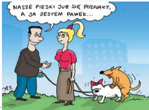
rys. Arkadiusz Szadkowski