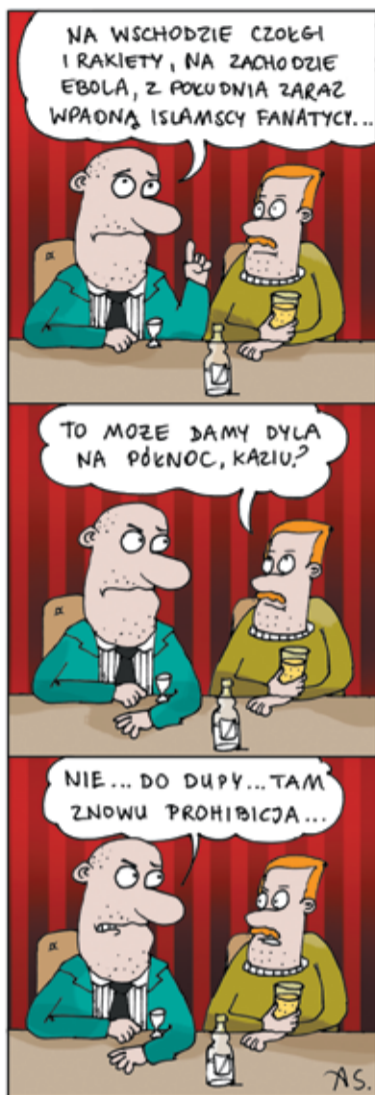
rys. Arkadiusz Szadkowski

Które akcje mają największy wpływ na główne indeksy na Giełdzie Papierów Wartościowych? - Akcje CBA, CBS i ABW