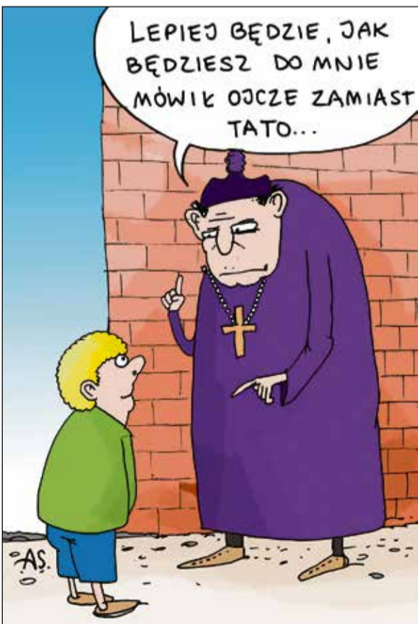
rys. Arkadiusz Szadkowski