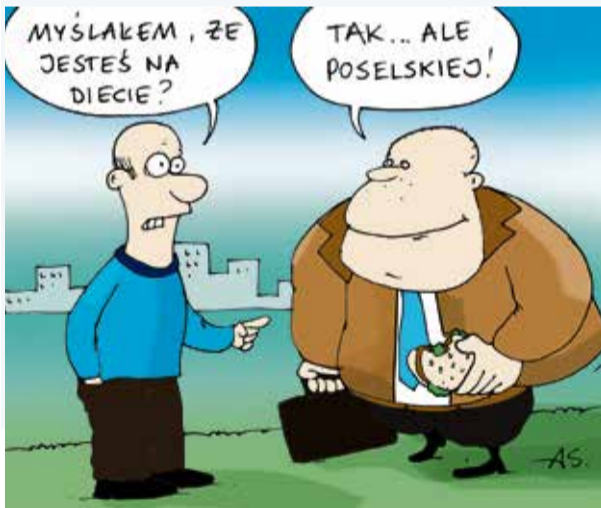
rys. Arkadiusz Szadkowski

Nie cierpię wegetarian, bo zżerają jedzenie mojemu jedzeniu.