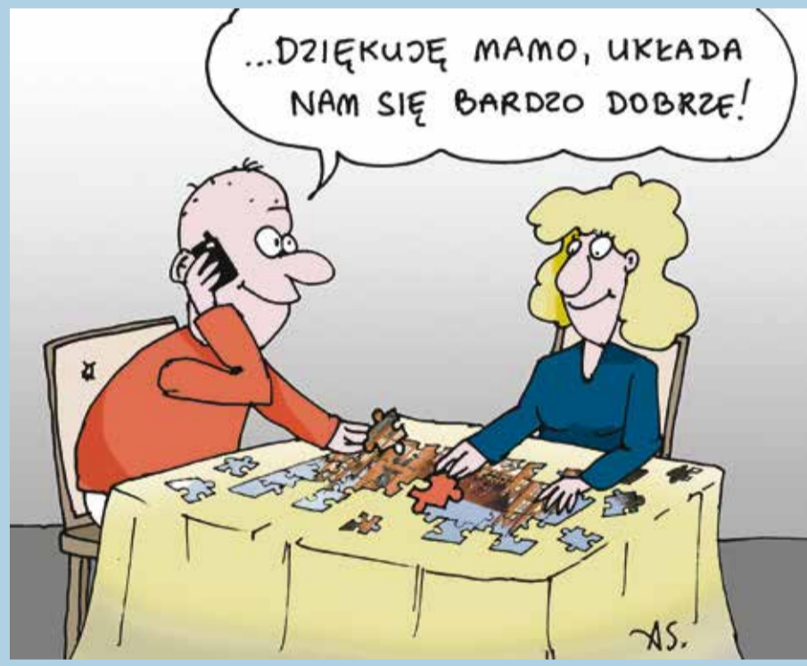
Rys. Arkadiusz Szadkowski

Żona do męża wracającego do domu nad ranem: - gdzie byłeś? - Jak to gdzie, u Janka na brydzu! Żona dzwoni do Janka: Był u ciebie mój mąż na kartach? - Jak to był, siedzi i rozdaje.