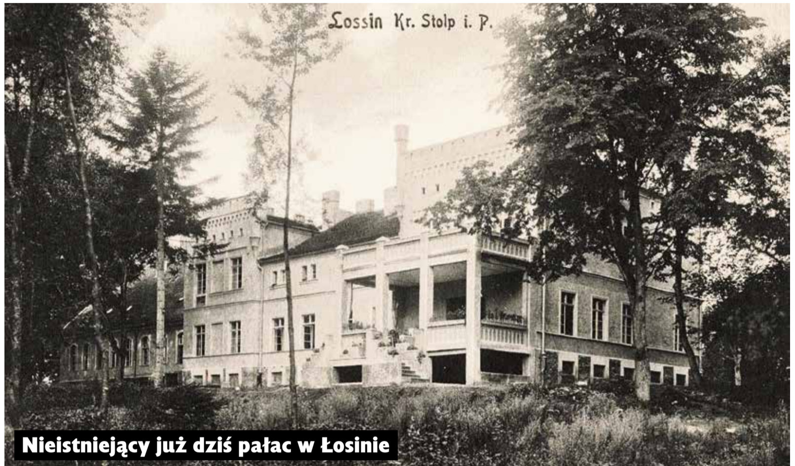
Nieistniejący już dziś pałac w Łosinie