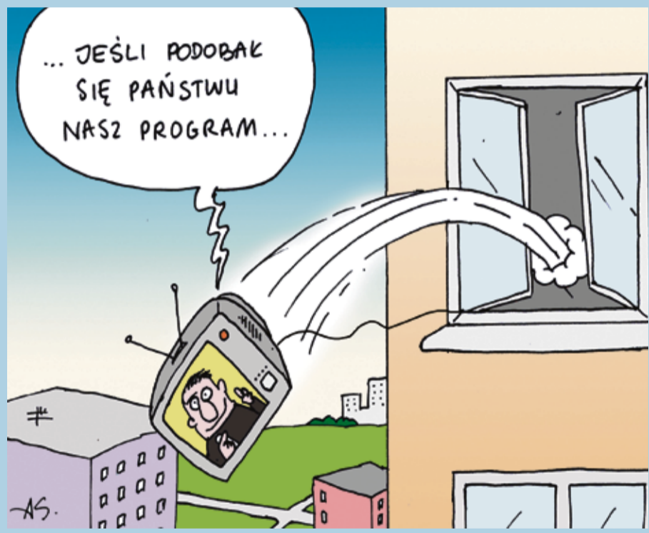
rys. Arkadiusz Szadkowski