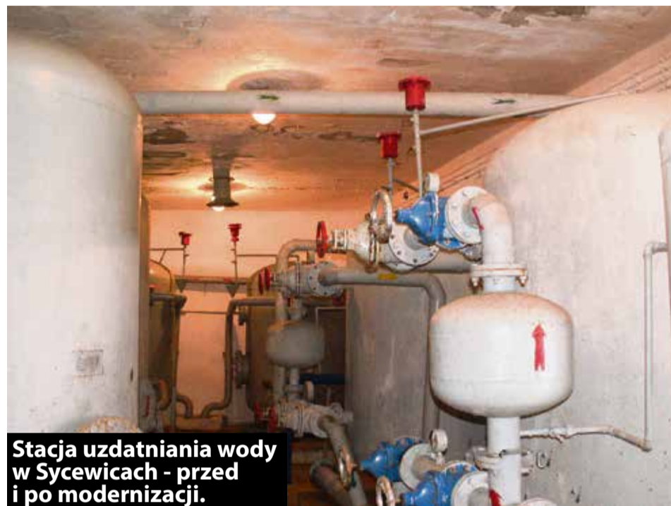
Stacja uzdatniania wody w Sycewicach - przed i po modernizacji.

AW. Prace związane z utrzymaniem infrastruktury i jakości wody stanowią największy skutek cenowy. Na terenie gminy Kobylnica funkcjonuje 20 stacji wodociągowych, które zaopatrują