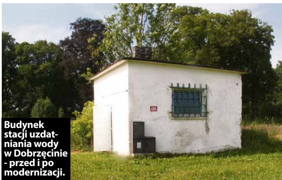
Budynek stacji uzdatniania wody w Dobrzęcinie - przed i po modernizacji.