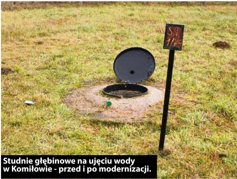
Studnie głębinowe na ujęciu wody w Komilowie - przed i po modernizacji.