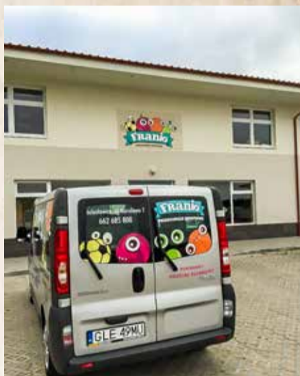
Szeroki dostęp do przedszkoli to ważny atut Gminy Kobylnica