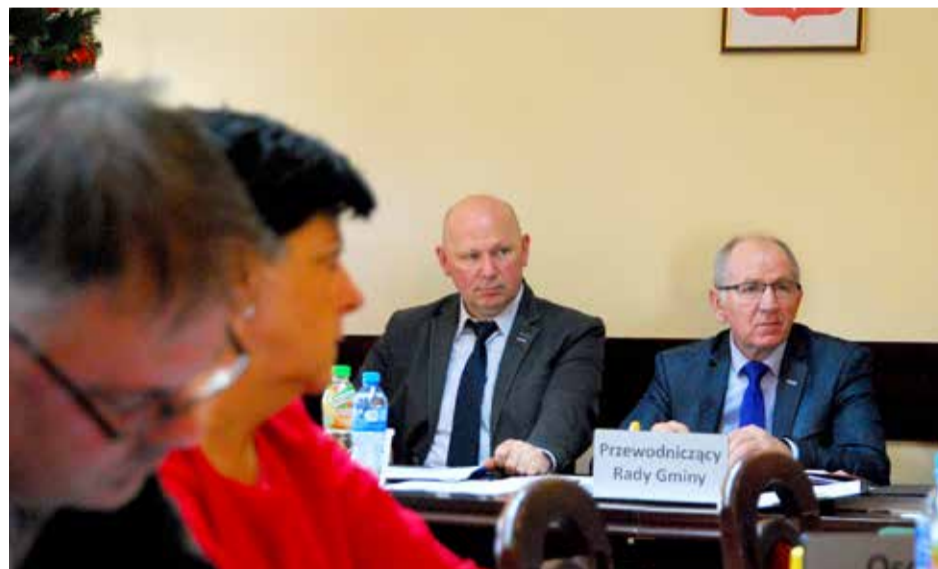
Rada Gminy Kobylnica większością głosów przyjęła budżet na 2016 rok. Więcej informacji w kolejnym wydaniu.