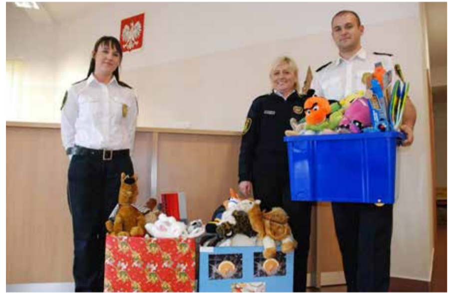
Listopadowa akcja strażników gminnych z pewnością ucieszy najmłodszych mieszkańców