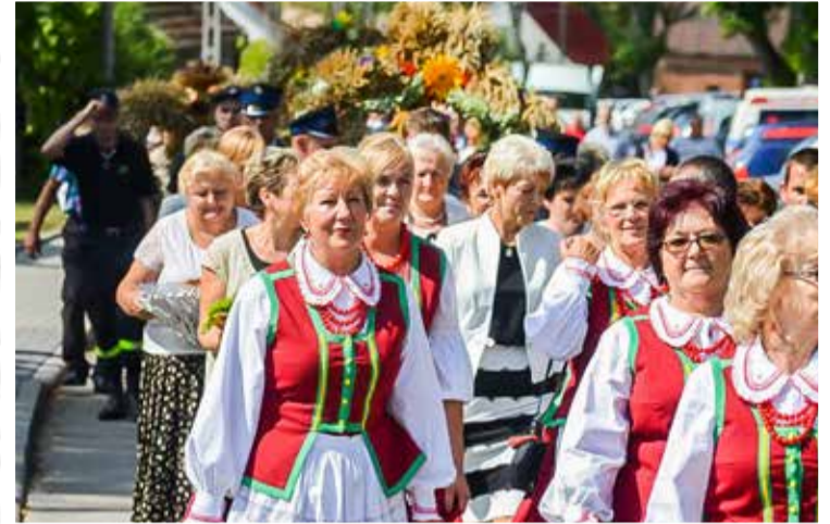
Zespół Ale Babki znany jest już w całym regionie