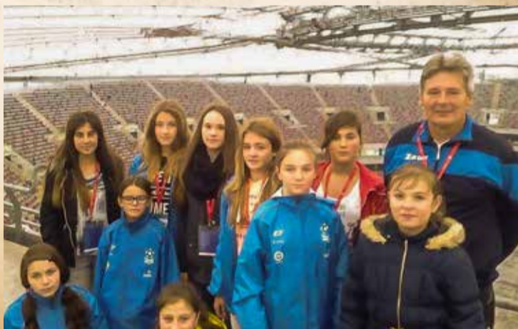
Zespół z Sycewic po zakończeniu warszawskiego turnieju

sukces, dający możliwość wejścia do wielkiego finału zarezerwowanego dla najlepszych, który rozegrano na Stadionie Narodowym w Warszawie.