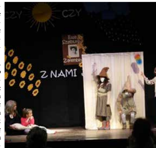
VI Gminny Konkurs Literacki

W nowe meble wyposażono filię w Sycewicach, dzięki czemu biblioteka stała się wygodną, nowoczesną placówką kulturalną.