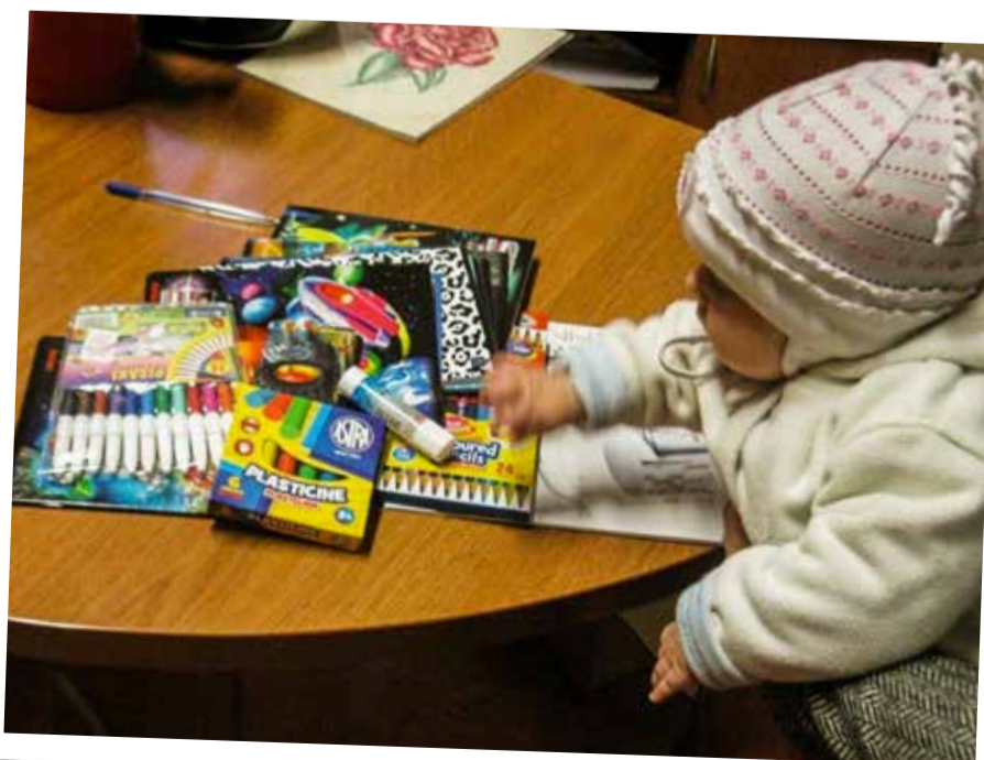
Książki, plecaki i zeszyty zebrane w trakcie akcji „Radosny Plecak”