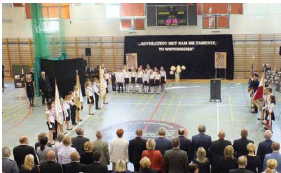
Mocna oświata to mocna kadra dydaktyczna

zjum. Sukcesywnie i regularnie wzrasta nie tylko liczba uczniów i nauczycieli, ale także poszerzana jest baza dydaktyczna. W zespole funkcjonuje doskonale wyposażona biblioteka szkolna, która dysponuje 12 tysiącami woluminów. Szkoła jest z informatyzowania - posiada około 100 komputerów i terminali, 4 tablice interaktywne, 2 wizualizery i 20 projektorów multimedialnych. Uczniowie, tak jak od pierwszych lat istnienia, tak i teraz, nadal odnoszą sukcesy w konkursach przedmiotowych, artystycznych i sportowych.