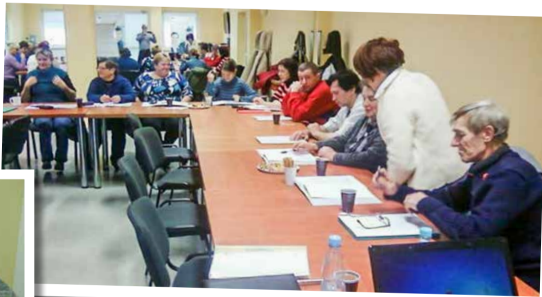
Uczestnicy projektu w trakcie spotkań z doradcami zawodowymi