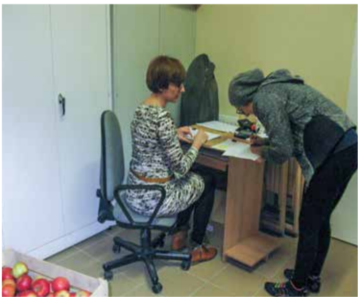
Osoby najbardziej potrzebujące zawsze mogą liczyć na wsparcie