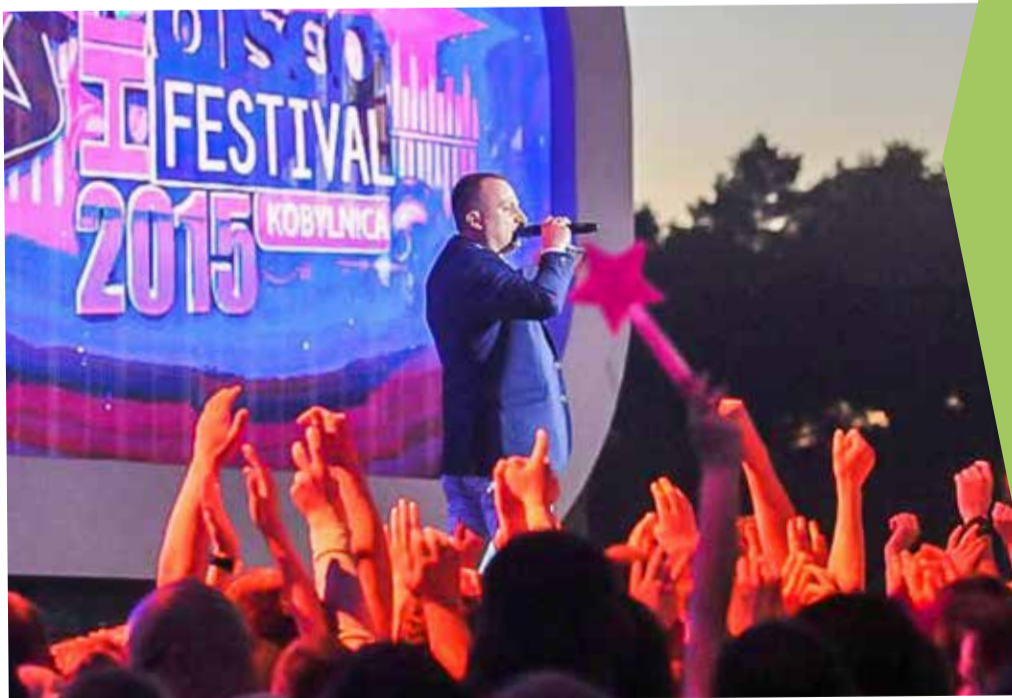
Disco Hit Festiwal to markowy produkt Gminy Kobylnica

W ramach Gminnego Centrum Kultury i Promocji w Kobylnicy działają też Orkiestra GCKiP w Kobylnicy, Zespół wokalny Ale Babki oraz Zespół wokально-instrumentalny El senior.