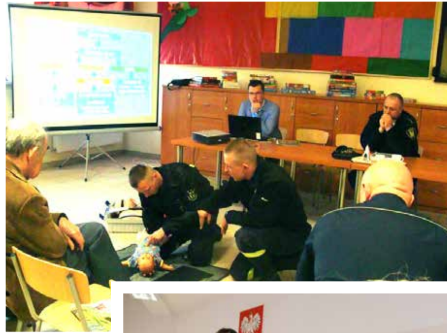
Zajęcia z pierwszej pomocy były jednym z elementów spotkań, które organizowano w ramach akcji „Jak dobrze mieć sąsiada”

Inne wnioski mieszkańców dotyczyły również wydłużenia trasy istniejącej już linii nr 5. W związku z tym w rejonie ulicy Kalinowej powstała pętla, zatoka autobusowa oraz specjalna wiata przystankowa. Dzięki temu dojazd do Słupska jest dużo łatwiejszy i wygodniejszy.