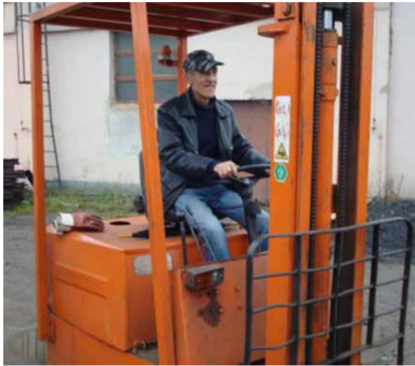
W Gminie Kobylnica realizowanych jest wiele działań i szkoleń, które mają pomóc mieszkańcom w odnalezieniu się na rynku pracy

Pracownicy Ośrodka Pomocy Społecznej nie zapominają też o najmłodszych. W tym roku, po raz pierwszy, zorganizowano akcję pod hasłem „Radosny Plecak”. Przez kilka tygodni prowadzono zbiórkę artykułów szkolnych, które następnie przekazano najbardziej potrzebującym.