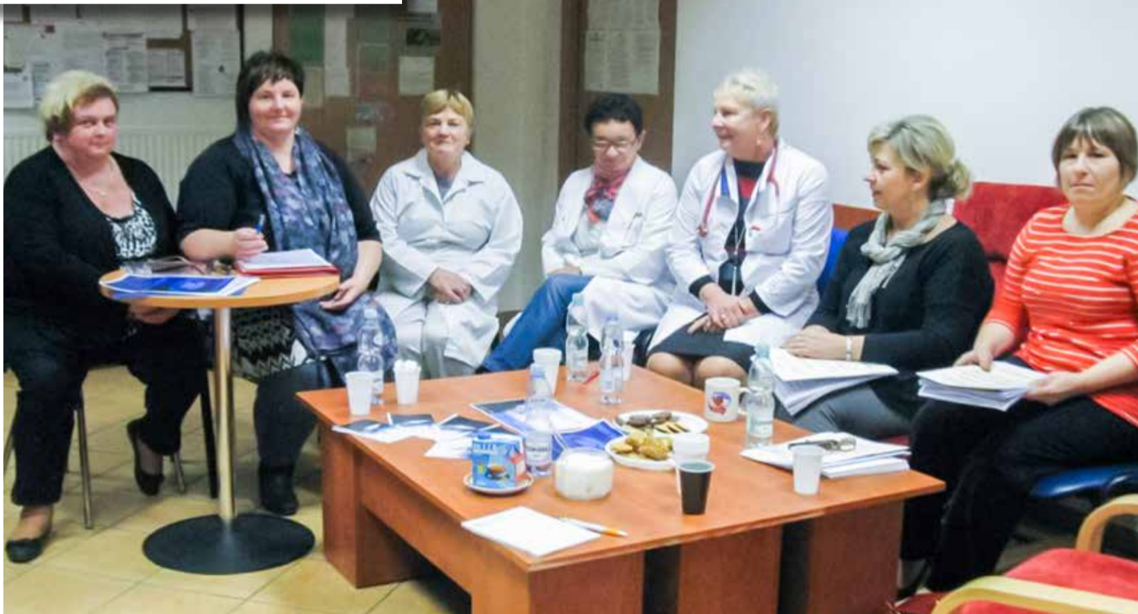
Warsztaty dotyczące rozpoznawania występującej przemocy w rodzinie