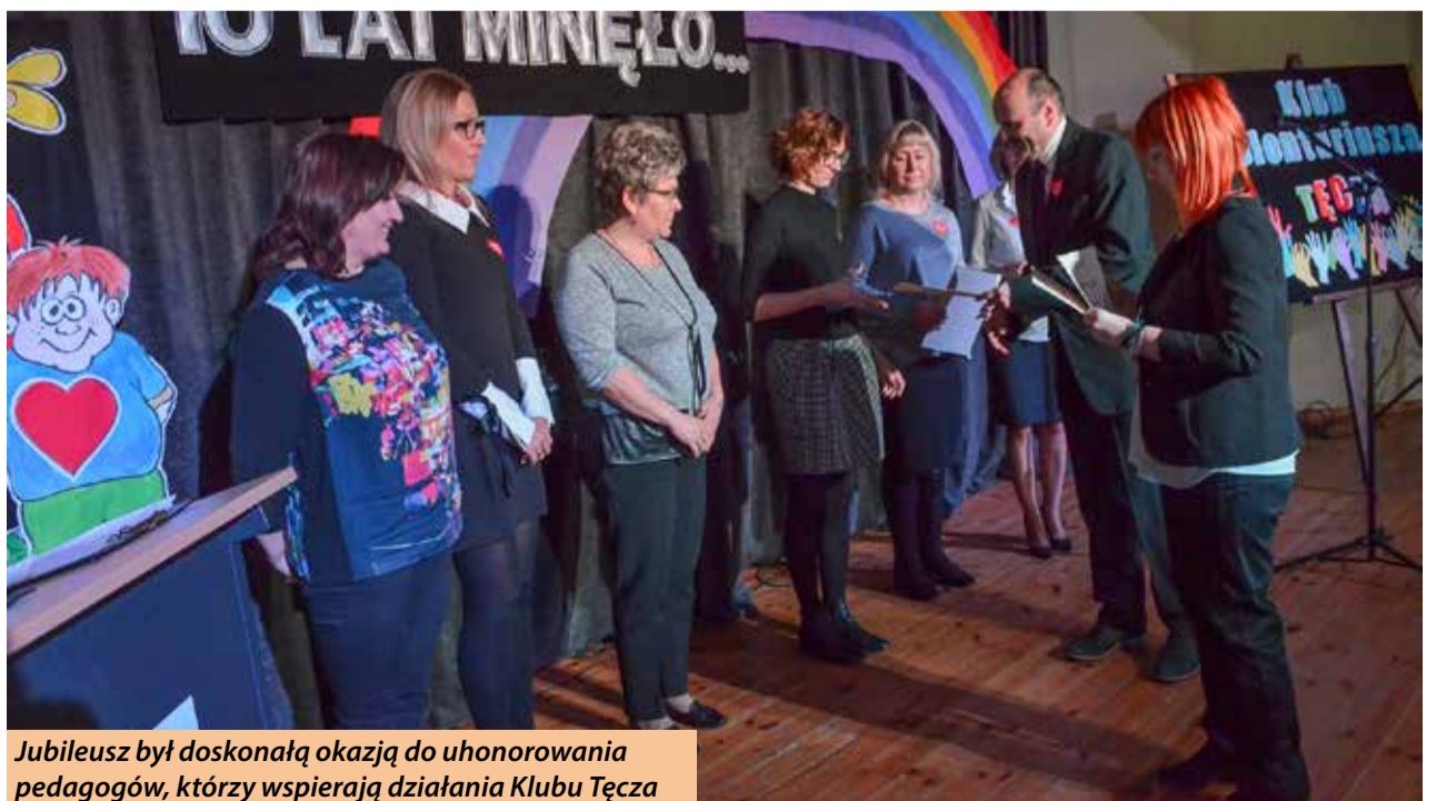
Jubileusz był doskonałą okazją do uhonorowania pedagogów, którzy wspierają działania Klubu Tęcza

W czasie piątkowej Gali Wójt Gminy Kobylnica wręczył opiekunom „Tęczy” listy gratulacyjne a na rzecz klubu przekazał multimedialne urządzenie wielofunkcyjne, które ma pomóc uczniom w realizacji kolejnych zadań. Całe wydarzenie uświetniły występy artystyczne uczniów miejscowej szkoły.