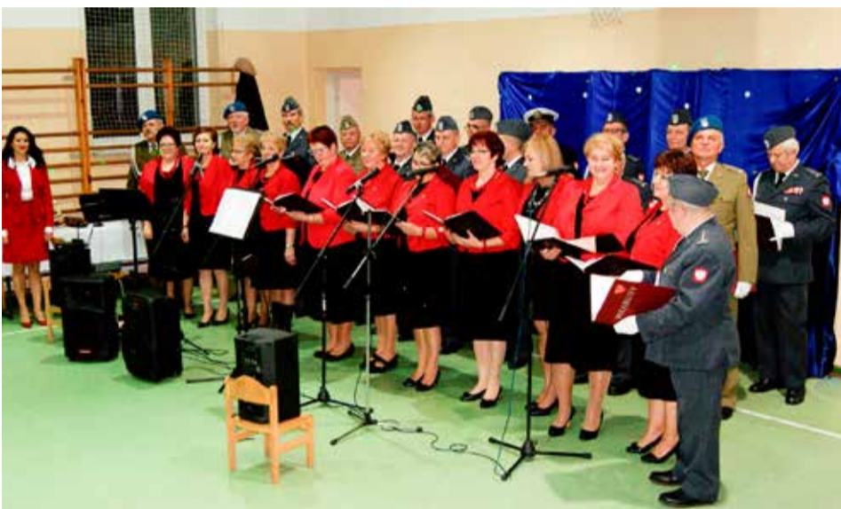
Ale Babki i WZW „Wiarusy” na jednej scenie. To był wyjątkowy koncert