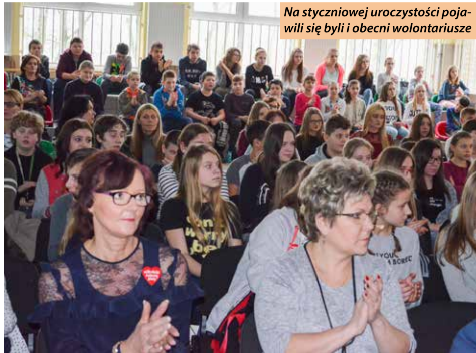
Na styczniowej uroczystości pojawili się byli i obecni wolontariusze

Działania „Tęczy” to również aktywna współpraca przy realizacji wielu projektów, które prowadzone są na terenie Zespołu Szkół Samorządowych w Kobylnicy. Są to między innymi zbiórki zużytych baterii, plastikowych nakrętek czy karmy dla bezdomnych zwierząt.