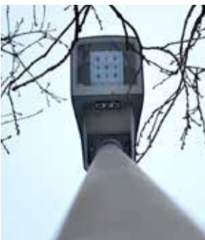
Wzdłuż drogi prowadzącej ze Stonowic do Dobrzęcina stanęło 14 nowych lamp

Powyższe roboty budowlane znacznie wpłyną na zwiększenie bezpieczeństwa, poprawę warunków i komfortu pieszych, w tym przede wszystkim dzieci i młodzieży w wieku szkolnym.