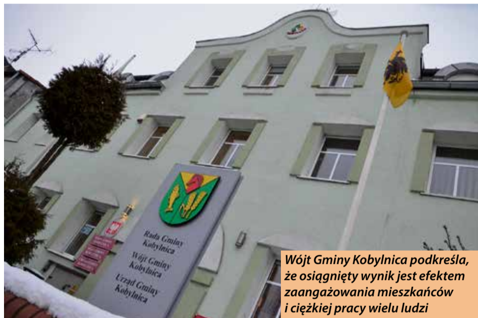
Wójt Gminy Kobylnica podkreśla, że osiągnięty wynik jest efektem zaangażowania mieszkańców i ciężkiej pracy wielu ludzi

Ogólnopolski Ranking Powiatów i Gmin prowadzony przez Związek Powiatów Polskich oparty jest na zasadzie bezpłatnego i dobrowolnego uczestnictwa wszystkich samorządów szczebla gminnego i powiatowego.