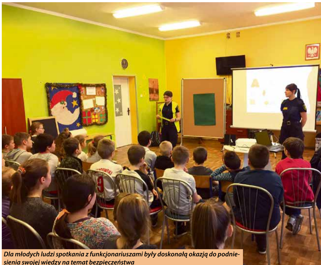
Dla młodych ludzi spotkania z funkcjonariuszami były doskonałą okazją do podniesienia swojej wiedzy na temat bezpieczeństwa

Spotkania z młodymi mieszkańcami organizowane są od kilku lat, tuż przed rozpoczęciem ferii zimowych. Jak mówią sami funkcjonariusze, wiedza uczniów po trwającej kilkadziesiąt minut prelekcji, radykalnie się zmienia.