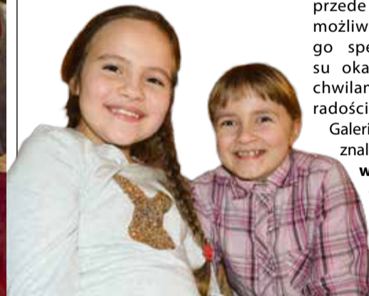
Spotkanie we Wrzącej upłynęło w milej i radosnej atmosferze

Galerię zdjęć można znaleźć na stronie www.kobylnica.pl