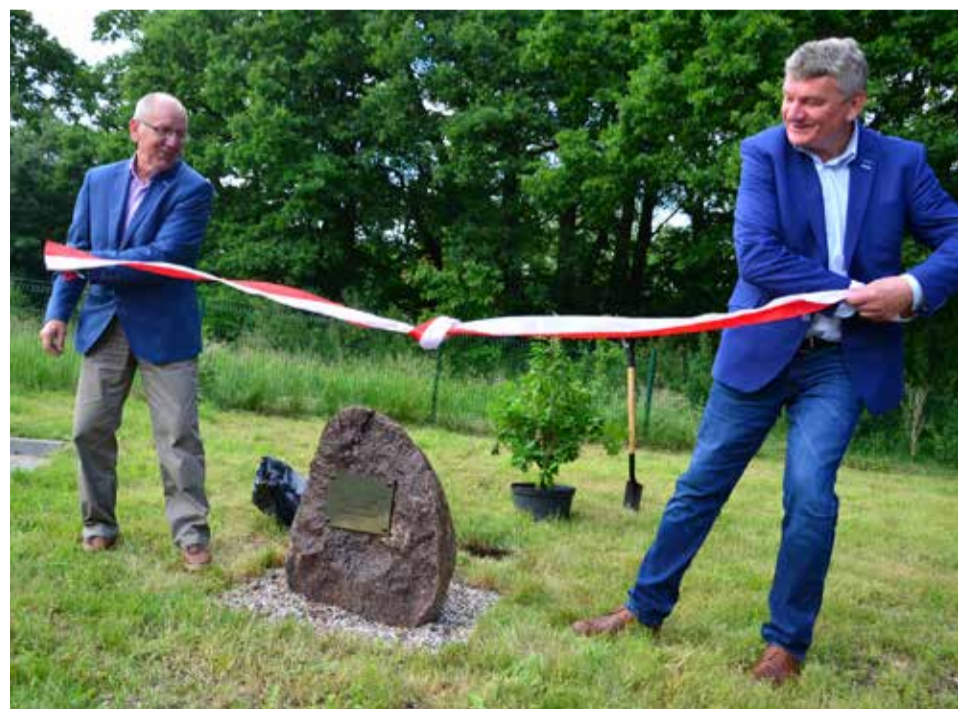
Obszerną galerię zdjęć z wydarzenia można znaleźć na stronie internetowej Gminy Kobylnica.

Jubileusz 65 – lecia upamiętnia również tablica, której odsłonięcia dokonano w czasie trwania imprezy. Nieopodal monumentu wkopano też sadzonkę dębu.