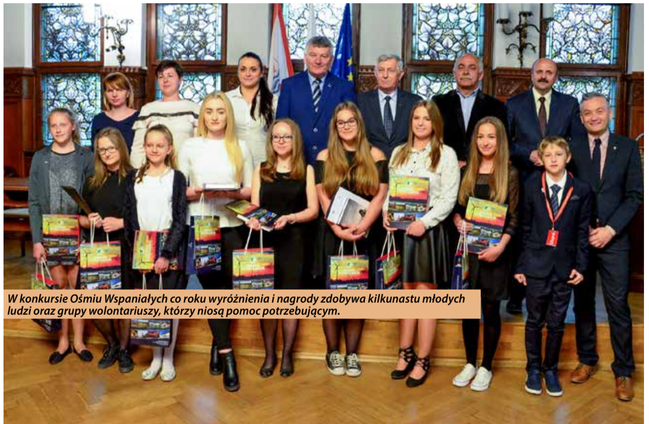
W konkursie Ośmiu Wspaniałych co roku wyróżnienia i nagrody zdobywa kilkunastu młodych ludzi oraz grupy wolontariuszy, którzy niosą pomoc potrzebującym.

Nagrodzone osoby otrzymały z rąk organizatorów konkursu oraz towarzyszących im samorządowców odznaczenia „Ośmiu Wspaniałych” oraz nagrody rzeczowe. Młodzi ludzie jednomyślnie przyznali, że jest to dla nich ogromna mo-