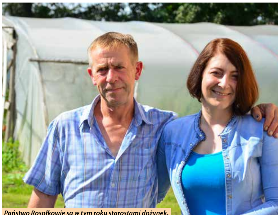
Państwo Rosołkowie są w tym roku starostami dożynek.