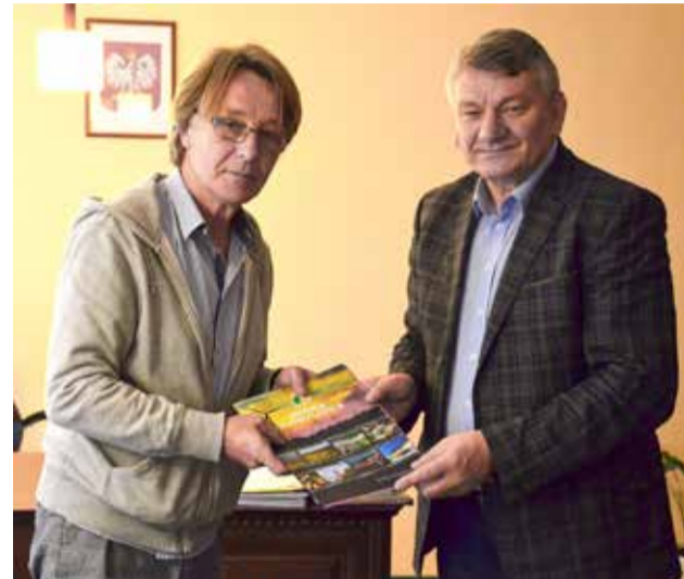
Umowę z wykonawcą nowego kompleksu sportowego podpisano 10 sierpnia w siedzibie Urzędu Gminy Kobylnica.

Warto podkreślić, że będzie to kolejna inwestycja sportowa, jaka w najbliższym czasie realizowana będzie w Gminie Kobylnica. W ciągu najbliższych dwóch lat sporej modernizacji ulegnie stadion w Sycewicach. Prace na obiekcie pochłoną prawie 1,3 miliona złotych. Przedsięwzięcie będzie realizowane z udziałem środków pozyskanych z Funduszu Rozwoju Kultury Fizycznej. Kwota dofinansowania wyniesie prawie 600 tysięcy złotych.