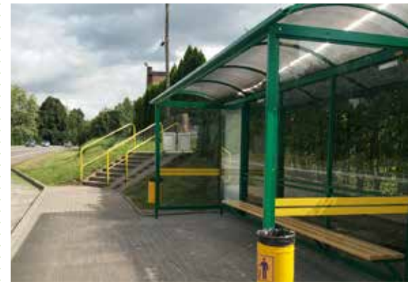
Jedna z nowych wiat przystankowych stanęła w Sycewicach. Kolejne w Bzowie i Zębowie.

Wiaty zostały zakupione w ramach środków finansowych budżetu Gminy Kobylnica. Inwestycja pochłonęła 22 100 zł.