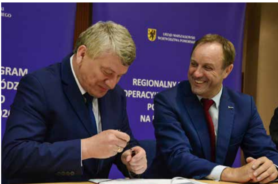
Marszałek Województwa Pomorskiego i Wójt Gminy Kobylnica podpisują umowę na dofinansowanie projektu renaturyzacji trzech zbiorników wodnych.

Na poprawę stanu czterech zbiorników wodnych na terenie Gminy Kobylnica potrzeba będzie ponad milion złotych. Starania samorządu zaowocowały otrzymaniem dofinansowania na całość prac w wysokości 70% kosztów kwalifikowanych. Umowę w tej sprawie podpisano 18 sierpnia w Urzędzie Marszałkowskim Województwa Pomorskiego w Gdańsku.