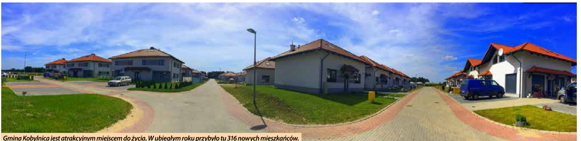
Gmina Kobylnica jest atrakcyjnym miejscem do życia. W ubiegłym roku przybyło tu 316 nowych mieszkańców.

osób), Dopiewie (758 osób) i Tarnowie Podgórnym (644 osoby), a także w dolnośląskiej Długołęce (844 osoby) i pomorskim Pruszczu Gdańskim (789 osób). Dodatkowo saldo migracji wewnętrznych odnotowała także Gmina Kobylnica. W ubiegłym roku przybyło tu 316 nowych mieszkańców. Taki wynik uplasował nasz samorząd na 43. miejscu w kraju.