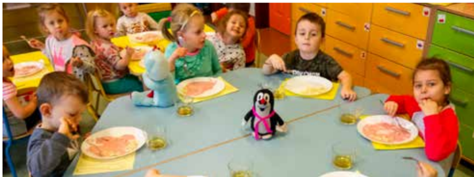
Maskotka Krecika podróżuje po Polsce. W grudniu pojawiła się w Kwakowie.

Na wystawie zaprezentowana zostanie także mapa Polski, na której zaznaczona będzie trasa podróży Krecika. Powstanie również prezentacja multimedialna dokumentująca przygodę małego podróżnika. Odtworzona zostanie ona na pokazie zorganizowanym w Miejskim Przedszkolu nr 13 im. Krecika w Częstochowie, a także we wszystkich zainteresowanych przedszkolach biorących udział w projekcie.