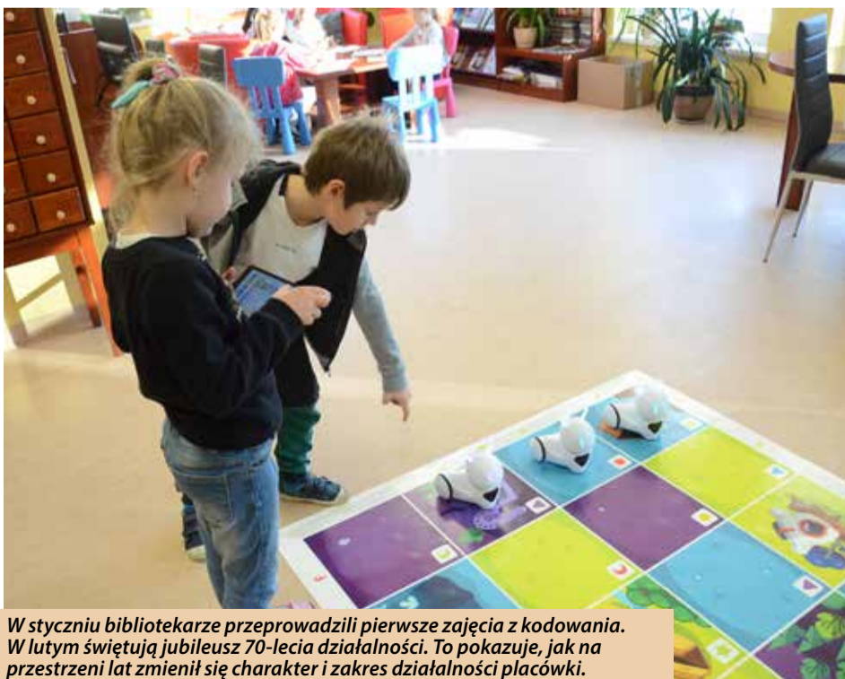
W styczniu bibliotekarze przeprowadzili pierwsze zajęcia z kodowania. W lutym świętują jubileusz 70-lecia działalności. To pokazuje, jak na przestrzeni lat zmienił się charakter i zakres działalności placówki.