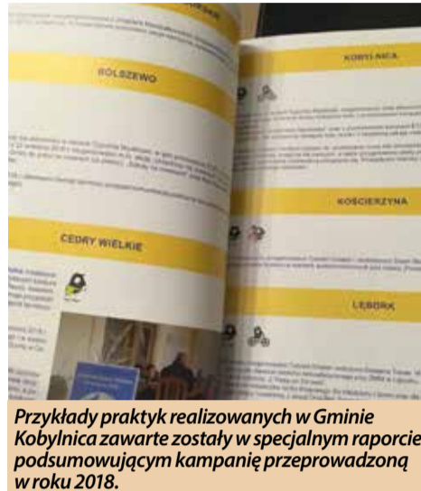
Przykłady praktyk realizowanych w Gminie Kobylnica zawarte zostały w specjalnym raporcie podsumowującym kampanię przeprowadzoną w roku 2018.

Europejski Tydzień Zrównoważonego Transportu jest organizowany każdego roku w połowie września. Celem działań jest promocja ekologicznych form mobilności, takich jak środki transportu zbiorowego, rower, ruch pieszy oraz transport multimodalny czyli łączenie różnych gałęzi transportu.