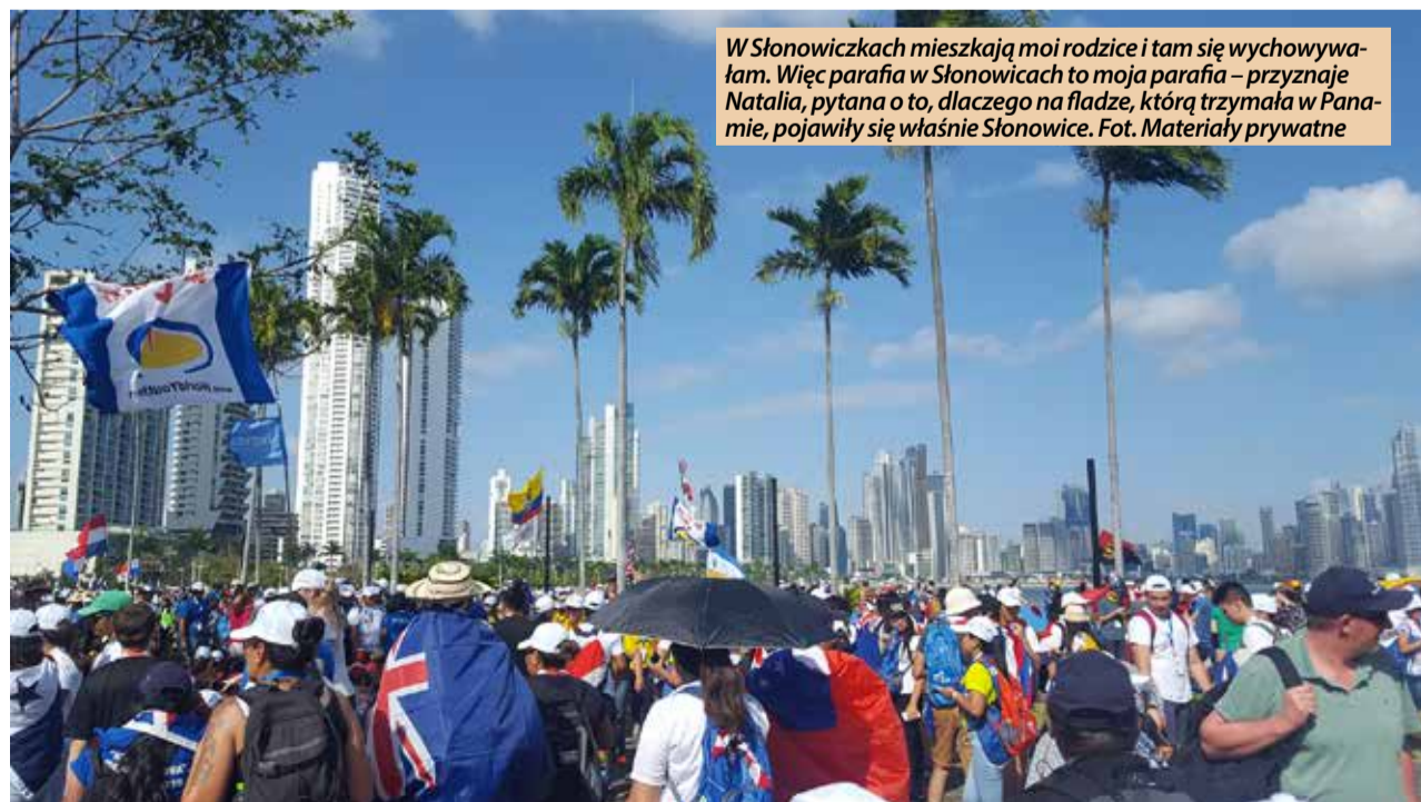
W Słonowiczkach mieszkają moi rodzice i tam się wychowywałam. Więc parafia w Słonowicach to moja parafia - przyznaje Natalia, pytana o to, dlaczego na fladze, którą trzymała w Panamie, pojawiły się właśnie Słonowice.