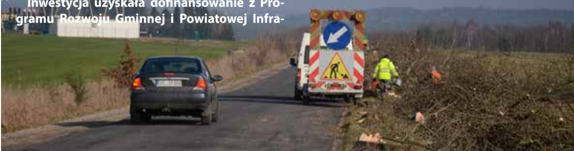
Prace przygotowawcze rozpoczęły się od wycinki drzew.

struktury Drogowej. W tej chwili odbywa się wycinka drzew niezbędna do wykonania nowych nasadzeń. Kierowców prosimy o ostrożność i wyrozumiałość.