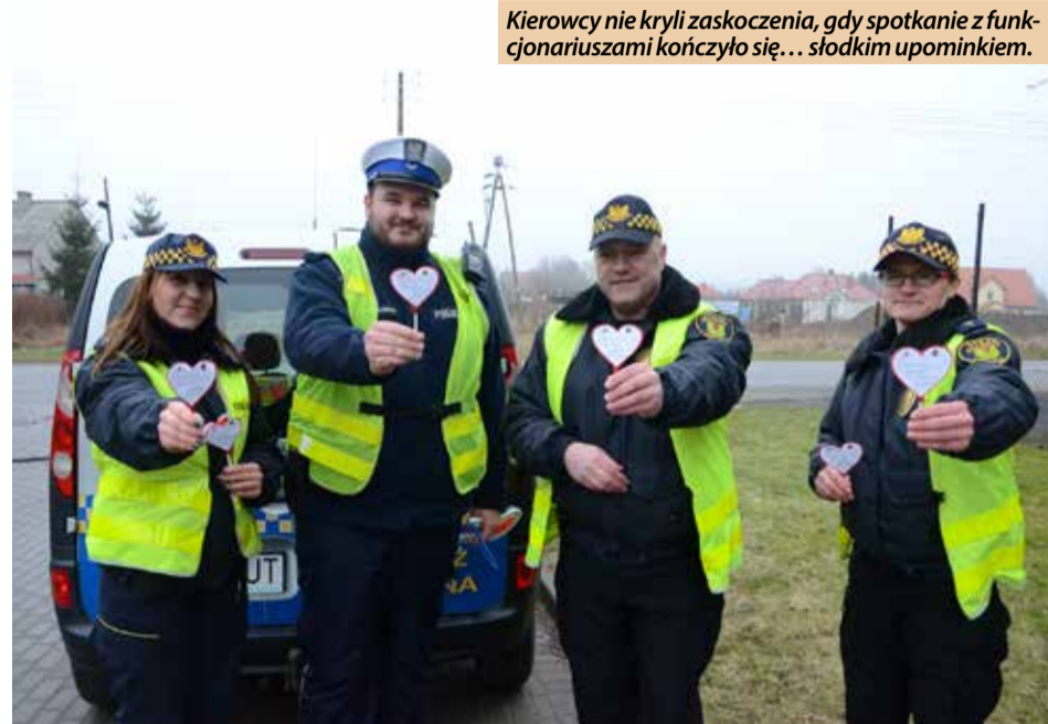
Kierowcy nie kryli zaskoczenia, gdy spotkanie z funkcjonariuszami kończyło się... słodkim upominkiem.

Wyjątkowe spotkanie z funkcjonariuszami kończyło się wręczeniem okolicznościowego upominku w postaci lizaka w kształcie serca. Kierowcy, w ramach rewanżu, dziękowali