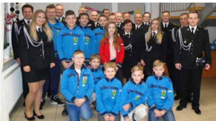
W zebraniu zorganizowanym przez jednostkę OSP Lubuń wzięli udział również młodzi adepci pożarnictwa. Zdjęcia z poszczególnych spotkań znaleźć można na stronie internetowej Gminy Kobylnica.

Kolejne zebrania sprawozdawcze OSP Gminy Kobylnica odbyły się 25 stycznia w jednostce OSP Kruszyna, 26 stycznia OSP Sierakowo, 1 lutego OSP Lulemino i 2 lutego OSP Sycewice.