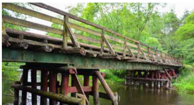
Tak jeszcze w czerwcu ubiegłego roku wyglądał most na Słupi w okolicach Łosina.

4,5 m i długości 27 m umożliwia przejazd również pojazdom o wadze do 40 ton. Wykonawcą robót budowlanych była spółka Rewers z siedzibą w miejscowości Bożepole Wielkie.