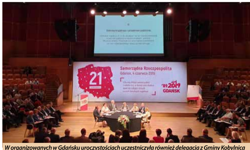
W organizowanych w Gdańsku uroczystościach uczestniczyła również delegacja z Gminy Kobylnica

zorganizowanych 4 czerwca. Wszystko rozpoczęło już w sobotę. Wówczas nowy okrągły stół został ustawiony przed Europejskim Centrum Solidarności, a w różnych częściach miasta wystartowały imprezy rozrywkowe, edukacyjne i historyczne.