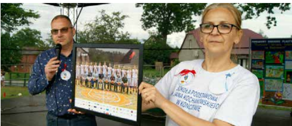
Oprócz bliskiego spotkania z kulturą i tradycją kaszubską, uczestnicy Festiwalu mogli wziąć udział w licytacjach bardzo ciekawych przedmiotów.

Organizatorem wydarzenia była miejscowa szkoła oraz Stowarzyszenie Przyjaciół Szkół Gminy Kobylnica. Wśród partnerów znaleźli się również: Kasa Stefczyka oraz FatWAY Catering.