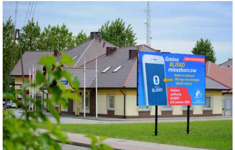
Do skorzystania z darmowej aplikacji BLISKO zachęca nowa konstrukcja reklamowa przy ulicy Wodnej w Kobylnicy.

Każdy nadawca proponuje własny zestaw serwisów – wybierz te serwisy, które Cię interesują (powiadomienia będą przychodzić tylko z wybranych serwisów).