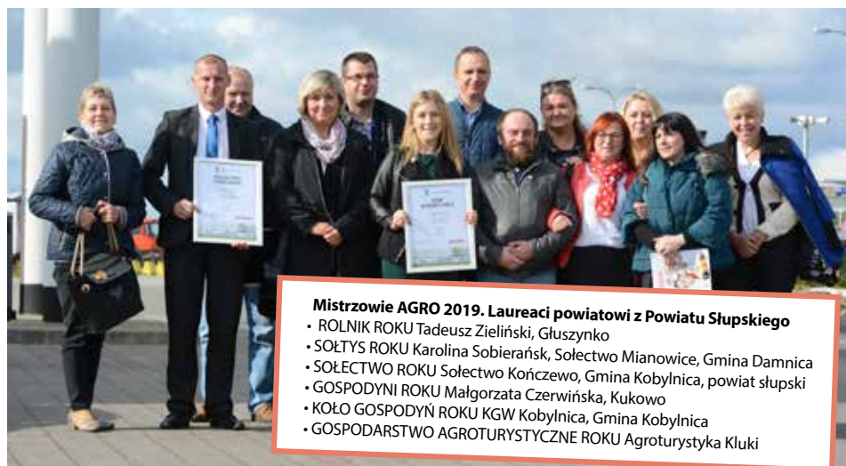
Gala podsumowująca cały plebiscyt odbyła się w Pomorskim Hurtowym Centrum Rolno – Spożywczym RĖNK. Tam KGW Kobylnica oraz przedstawiciele sołectwa Kończewo otrzymali okolicznościowe dyplomy

Laureaci zostali wybrani podczas głosowania, jakie zostało przeprowadzone za pośrednictwem portalu dziennikbaaltycki.pl .