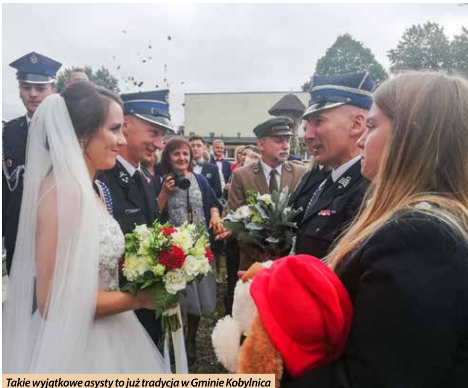
Takie wyjątkowe asysty to już tradycja w Gminie Kobylnica