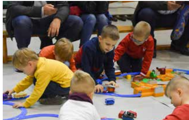
Więcej zdjęć z imprezy można znaleźć na stronie internetowej Gminy Kobylnica

Nie zabrakło animacji dla najmłodszych - modele ze styropianu, modele z kartonu do wycinania, rysowanki oraz kącik do zabawy pociągami dla dzieci.