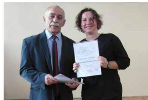
W czasie uroczystości w Sycewicach wręczono nagrody za osiągnięcia dydaktyczne. Zdjęcia z wydarzenia można znaleźć na profilu Gminy Kobylnica na Facebook'u