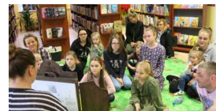
Kamishibai to technika opowiadania, czytania wywodząca się z Japonii, wykorzystująca plansze z obrazkami i tekstem. W języku potocznym określaną mianem teatru papierowego

Uczestnicy spotkania obejrżeli legendy pt. "Dlaczego w rzekach jest tyle kamieni?" oraz "O smoku wawelskim". Następnie sami stworzyli własną opowieść na podstawie tekstu Jana Brzechwy pt. "Na straganie". Dzieci i rodzice wspólnie wystawili narysowaną opowieść. Bawili się głosem i interpretacją tekstu.