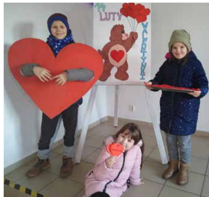
Zajęcia sprawiły, że wnętrza świetlic zostały ozdobione kolorowymi serduszkami wykonanymi przez dzieci różnymi technikami na zajęciach plastycznych pod opieką instruktorów