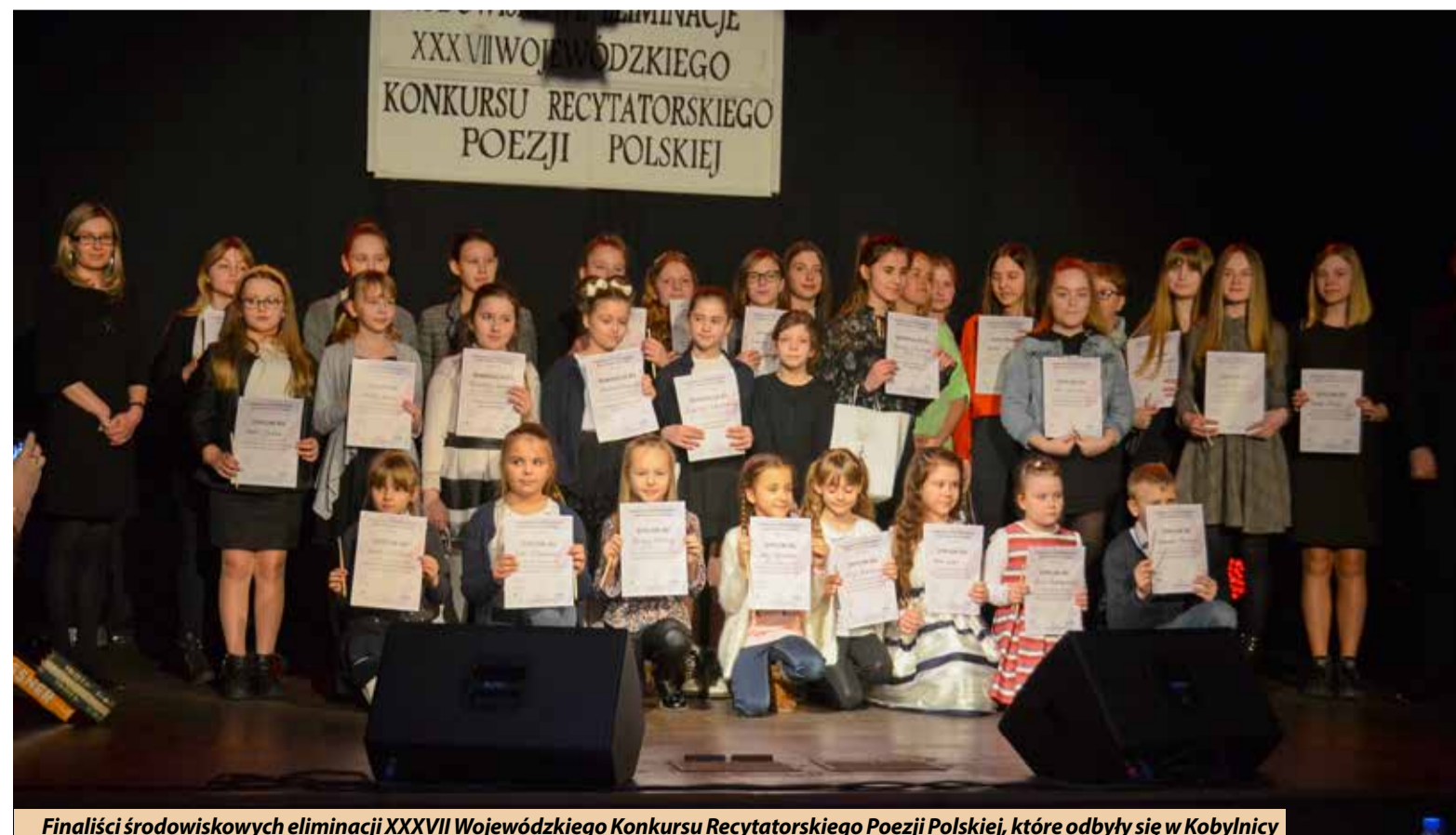
Finaliści środowiskowych eliminacji XXXVII Wojewódzkiego Konkursu Recytatorskiego Poezji Polskiej, które odbyły się w Kobylnicy

Zwycięzców etapu wojewódzkiego poznamy w maju.