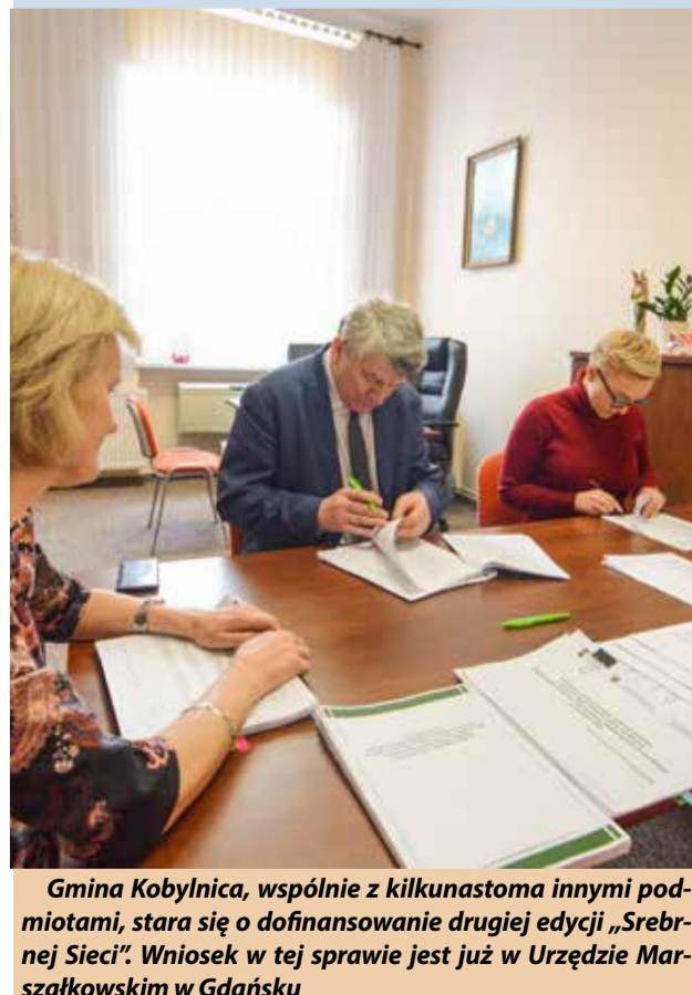
Gmina Kobylnica, wspólnie z kilkunastoma innymi podmiotami, stara się o dofinansowanie drugiej edycji „Srebrnej Sieci”. Wniosek w tej sprawie jest już w Urzędzie Marszałkowskim w Gdańsku