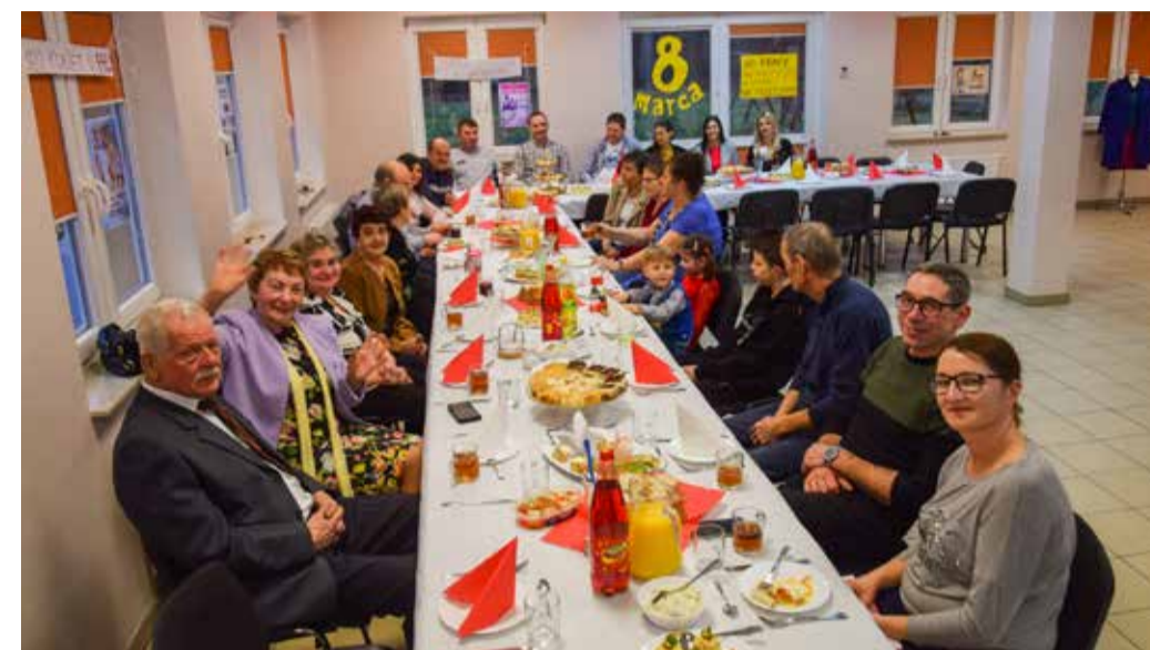
Część artystyczna była okazją do wysłuchania największych przebojów światowej muzyki lat 60 i 70.

Przy dźwiękach największych przebojów lat 60 i 70 mogli bawić się uczestnicy zabawy, którą zorganizowano w świetlicy wiejskiej w Reblinie. Okazją do wspólnego świętowania był Dzień Kobiet i Mężczyzn w stylu PRL-u.